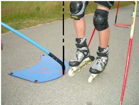
Gut – kein Torfehler !

Ein Torfehler liegt vor, wenn sich an der Torstange ein Teil eines Inlineskates über der gedachten Senkrechten der Torstange befindet!