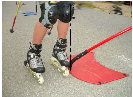
Skates am Boden – kein Torfehler !