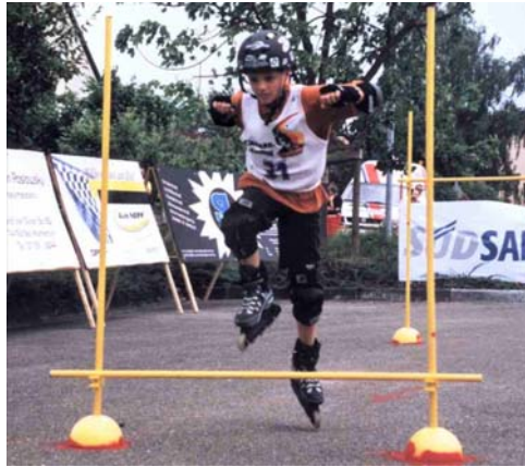
Übersteig- und Durchfahrtstation

Dieses Übungsteil sollte aus 1 Übersteig-, als zweites 1 Durchfahr- und als drittes aus einer Übersteigstation. Höhe der Übersteigstation min. 20 cm, max. 40 cm, Breite min 100 cm, max. 150 cm. Abstand der 3 Stationen jeweils 1,50 m bis 3 m. Abstand der drei Hindernissen jeweils 1,50 m bis 3 m . Höhe der Durchfahrtstation 100-150 cm.